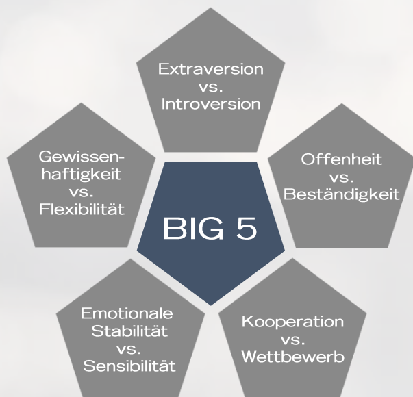
Abb. 1: Die Bidimensional Big Five des LPP

Das Big Five-Modell unterteilt die Persönlichkeit in fünf übergreifende, voneinander unabhängige Dimensionen (McCrae & Costa, 1987). Diese setzen sich wiederum aus jeweils sechs Facetten zusammen, aus denen sich auf Verhaltenspräferenzen schließen lässt (Ostendorf & Angleitner, 2004). So gelingt dem LPP eine differenzierte Betrachtung der Persönlichkeit.